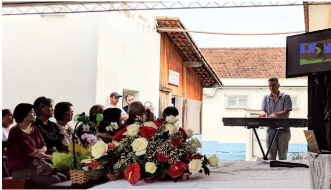
Uma imagem da cerimônia